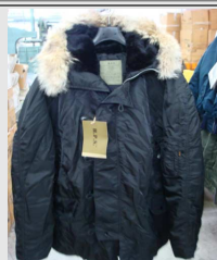
Parka N3-B Vintage H.P.S.